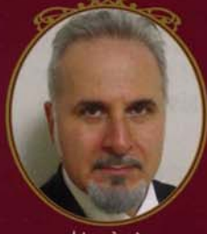
ナレーション アンジェロ デローザ