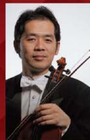
ゲストコンサートマスター 平山慎一郎