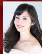
ナレーション・歌 和田美菜子